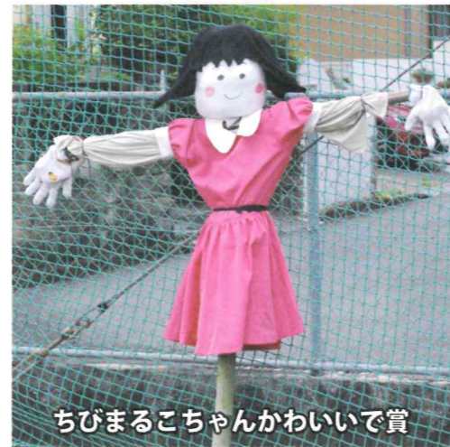
ちびまるこちゃんかわいで賞