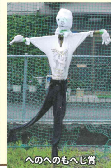
へのへのもへじ賞