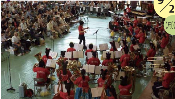
▲第二～第四地区敬老会